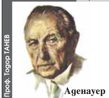
Проф. Тодор ТАНЕВ