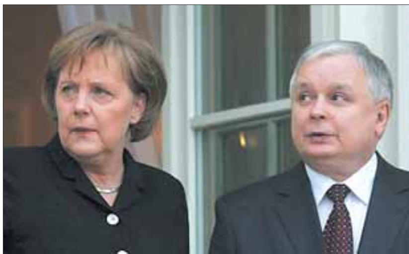
Меркел и Качински не гледат убедително в една посока.

Последните дни преди Среца на върха на ЕС бяха напрежени с напрежение. Преговорите за деблокиране на конституционния договор се засилиха и станаха по-настойтелни, сърдечният тон се изостри, противоречията излязоха на повърхността. В неделя и понеделник събраните в Люксембург външни министри на страните от ЕС не успяха да постигнат компромис по плана за срещата на върха. Миналата седмица Германия представи проект за обсъждане от Европейския съвет на срещата, предвиждащ според Би Би Си заместването на оспорваната европейска конституция с един опростен договор, който да бъде приет по обичайната за другите европейски договори процедура. Целта е да се избегнат референдумите, които доведоха до отхвърлянето на конституцията във Франция и Холандия.