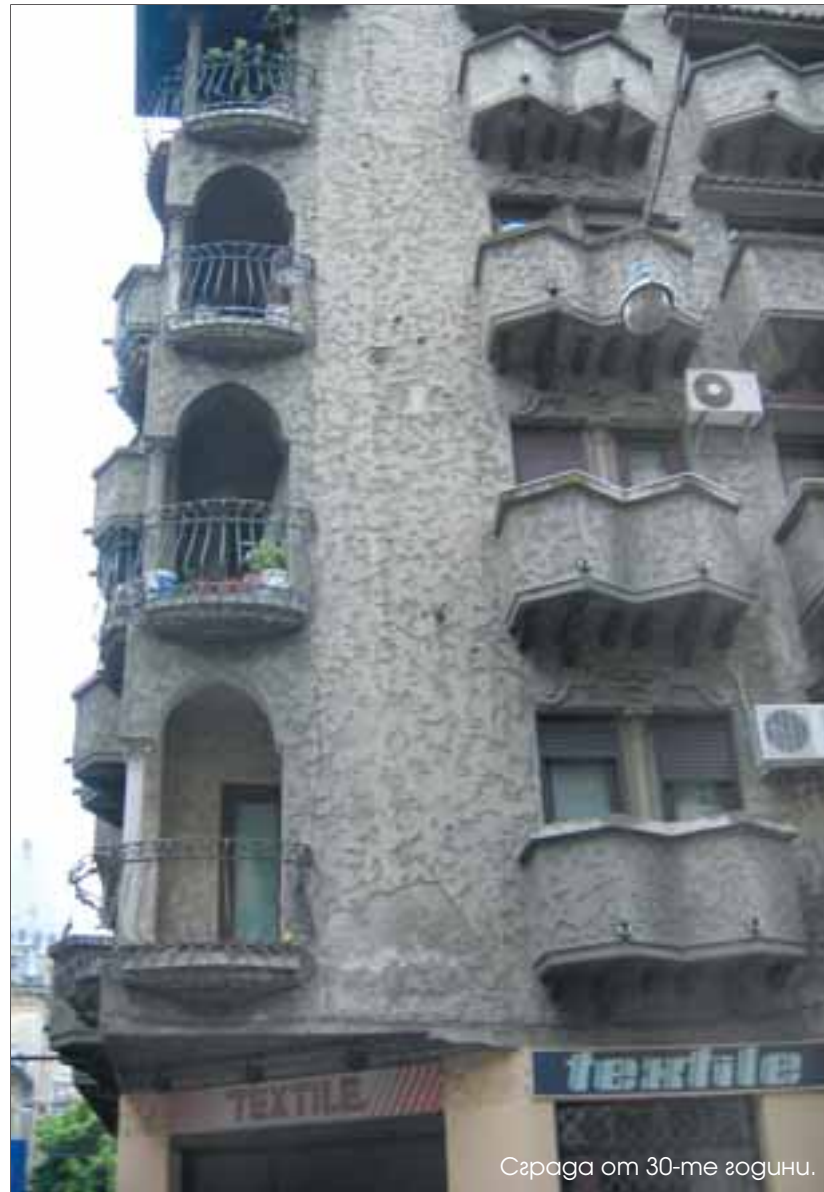
Сграда от 30-те години.