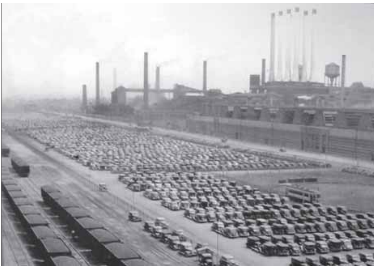
1908 г. – новият Бог, Хенри Форд, пуска на пазара достъпния за всеки американец модел Т. С което може би е променил живота на планетата – в дългосрочна перспектива – повече от Ленин, Сталин и Хитлер накуп.

На 1 януари 2007 г. България ще влезе в Европейския съюз. И пиццо ще празнува. Какво? Ако съдим по масовите блянове – Фордовден. Комуто не харесва, да чете Хъксли. ☺