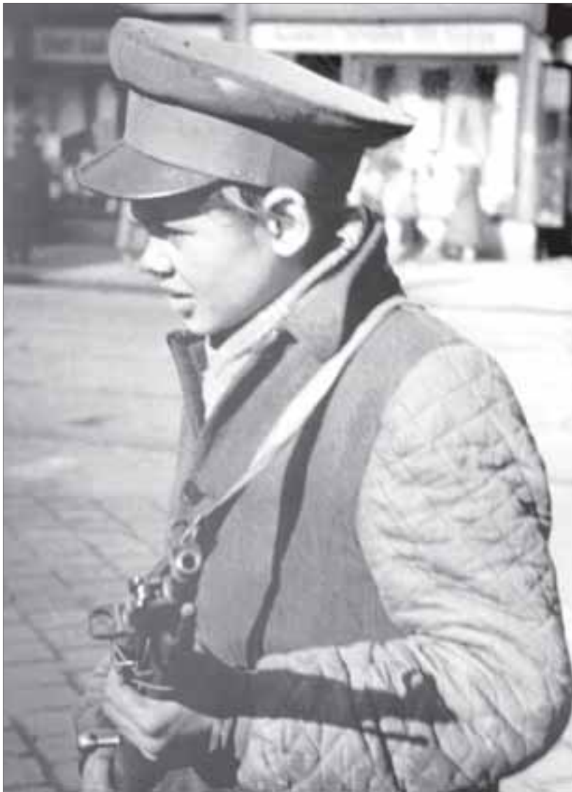
Използваме тази снимка, тъй като не разполагаме с оригиналната, за която става дума в текста.

Разбира се, че ролята на Запада в източноевропейските революции не е започнала да се обсъжда едва сега, тези дни, като внезапно възникнал въпрос, на който историците по недоглеждане не са