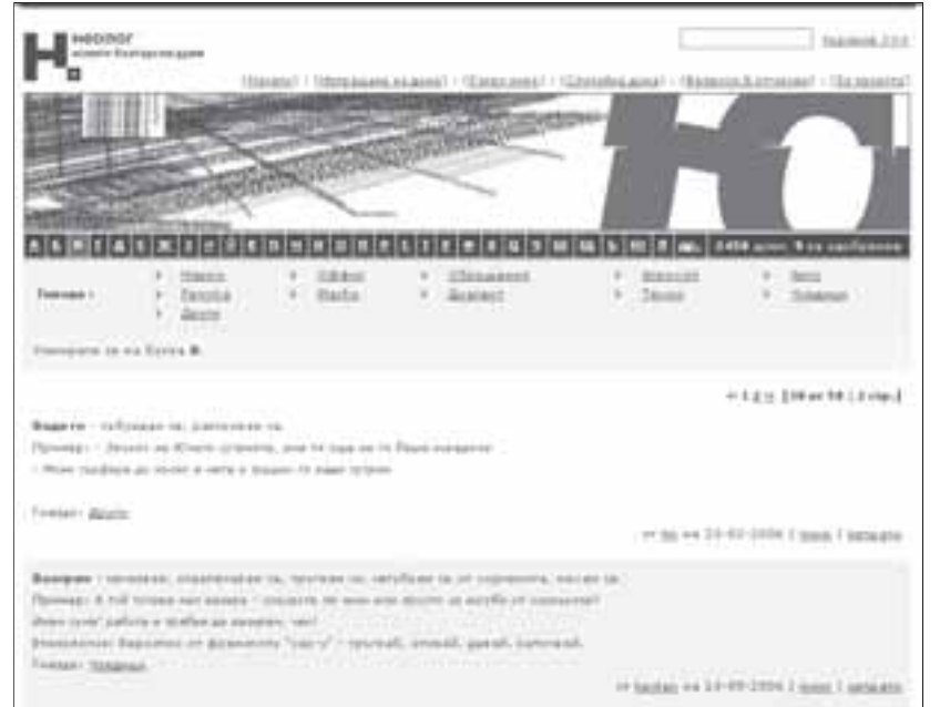
Изглед от сайта www.neolog.nl

През юни световните медици се умилеха, че глаголът, произведен от името на търсачката Google, е влязъл в 150-годишния Oxford English Dictionary . През октомври „гулирам“ или „гулвам“ на български се намира само в Неолога. Другаде тълковните речници се преиздават всяка година допълнени и коригирани. У нас това е многолетно начинание, което отчита глобалните затопляния, но проспива гребните форми на живот. В българските речници