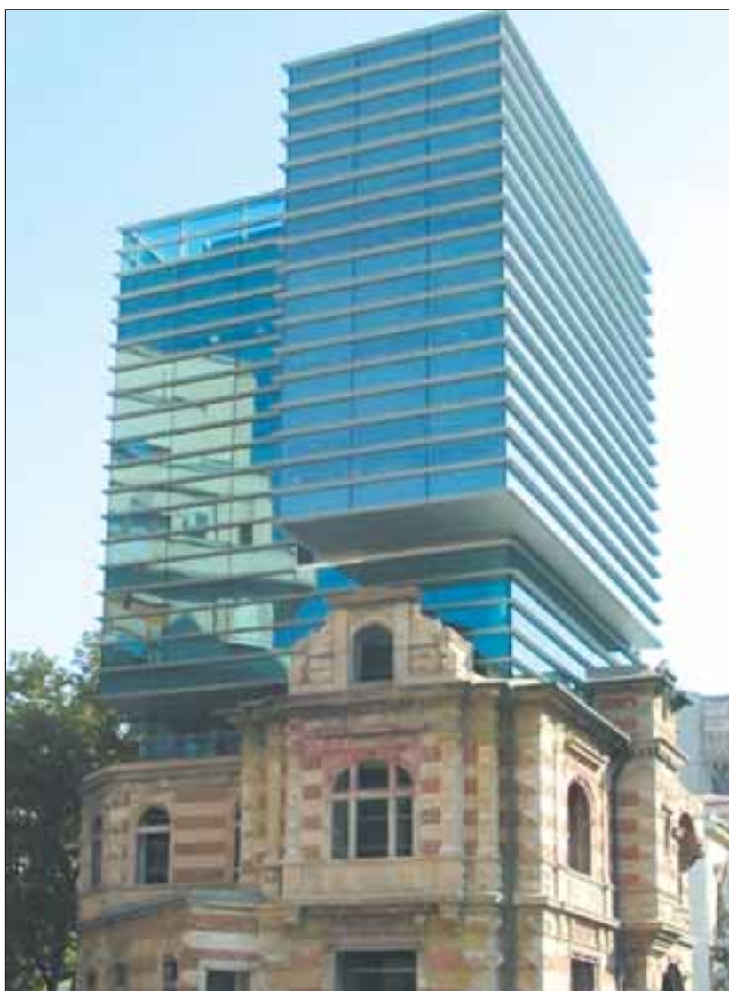
Централата на Асоциацията на румънските архитекти, построена върху руините на Дирекция 5 на Секуритате.