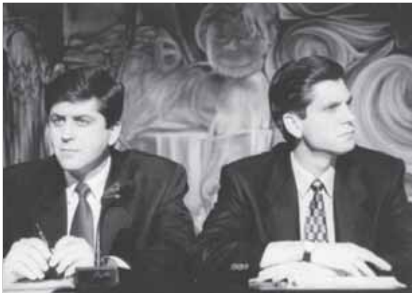
Снимка от времето, когато Жан Виденов беше председател на БСП, а Георги Първанов – негов заместник.

Дори когато тяхната неизбежност е очевидна, левицата прави всичко възможно и невъзможно да превърне динамиката на промените в едва доловимо помръждане. Един от любимите похвати за това беше натоварването на икономическите реформи с всевъзможни и непосилни социални функции. Типичен пример бе упоритото отстояване на тезата за „социално-ориентираната приватизация“, в която се акцентираше не на икономическите параметри на процеса, а на желаните социални ефекти от смяната на собствеността.